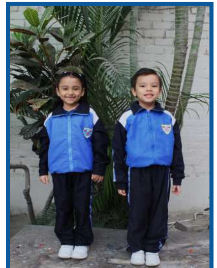
UNIFORME ED. FÍSICA