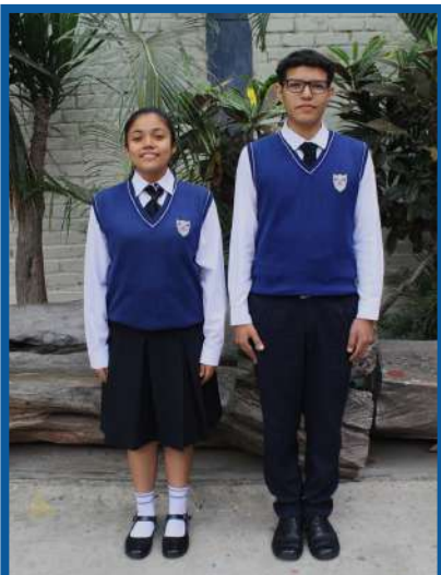
UNIFORME DE GALA

• Los uniformes podrán ser adquiridos por los padres de familia en los centros de venta o distribuidores de su preferencia.