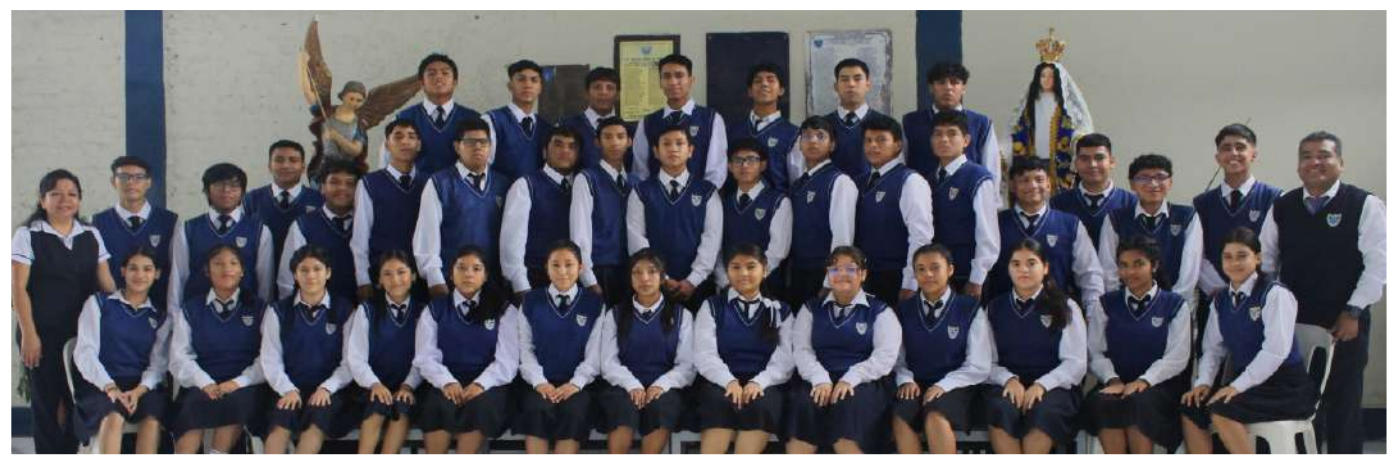
PROMOCIÓN 2023: “SUEÑOS ANHELADOS Y RUMBOS INFINITOS”

“Educación de calidad al servicio de la comunidad castellana”