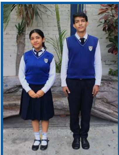
UNIFORME DE GALA

• Los uniformes podrán ser adquiridos por los padres de familia en los centros de venta o distribuidores de su preferencia.