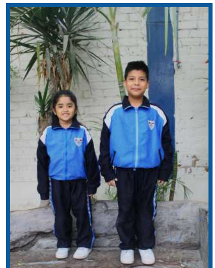
UNIFORME ED. FÍSICA